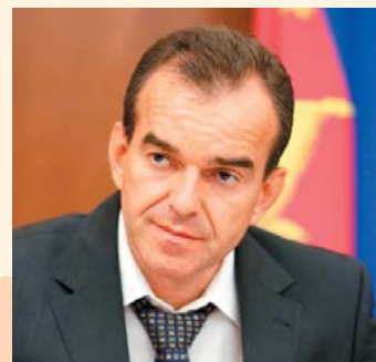
VENIAMINE KONDRATIEV Gouverneur de la région depuis 2015

LA RÉGION DE KRASNODAR EST SITUÉE DANS LE SUD DE LA PARTIE EUROPÉENNE DE LA RUSSIE ET EST BORDÉE PAR LA MER D'AZOV ET LA MER NOIRE.