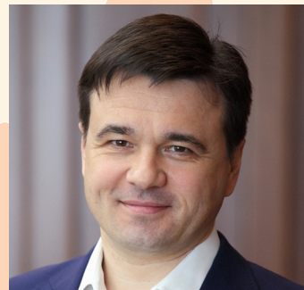
ANDREI VOROBIEV Gouverneur de la région depuis 2012