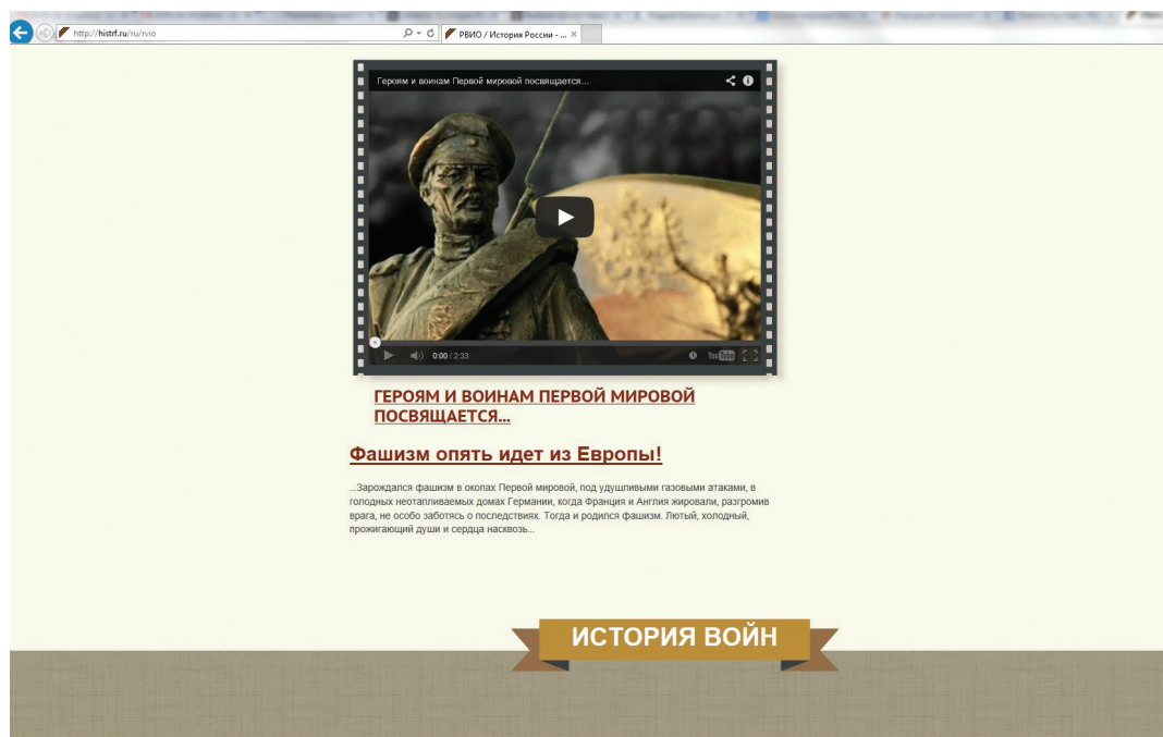
Главная страница сайта РВИО (принт-скрин, 26 мая 2014 г.)