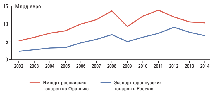
РИС. 1. ФРАНКО-РОССИЙСКИЙ ТОВАРООБОРОТ (2002–2014 ГГ.)